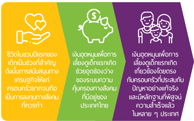
ภาพที่ 5: สารระสำคัญที่ใช้ผลักดันและสนับสนุนนโยบายเงินอุดหนุนฯ