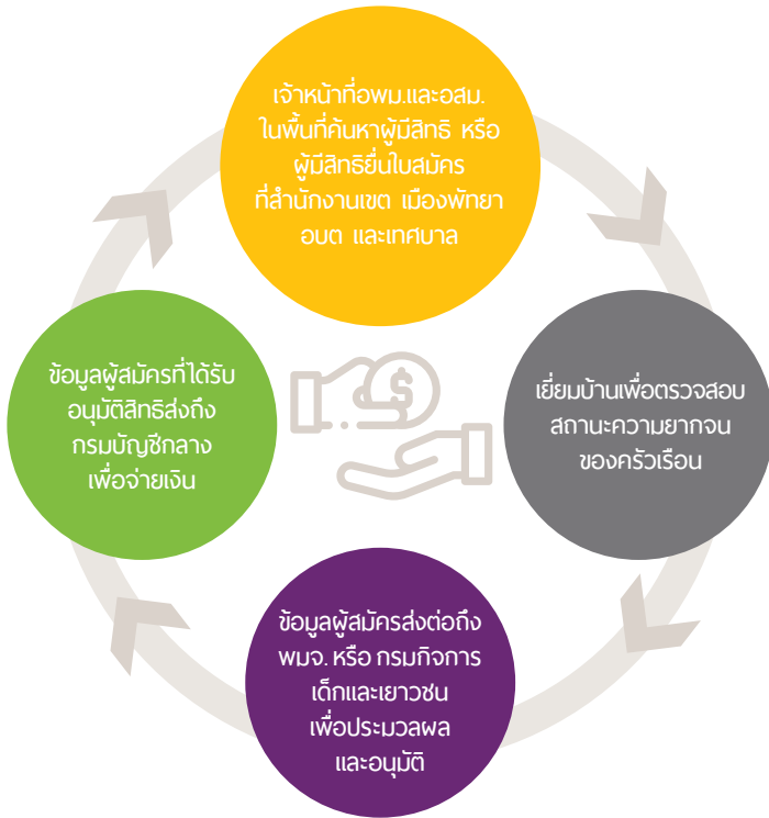
ภาพที่ 3: กระบวนการสมัคร ประมวลผล อนุมัติ และการจ่ายเงิน