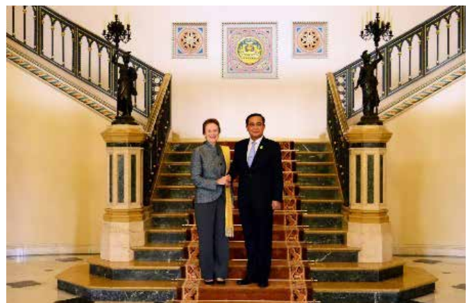
คุณ Fore ผู้อำนวยการบริหารองค์การยูนิเซฟ และ พลเอกประยุทธ์ จันทร์โอชา นายกรัฐมนตรี ณ กรุงเทพฯ ปี 2562