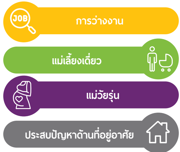
ภาพที่ 6: ข้อทำทนายของผู้ที่ได้รับเงินอุดหนุนฯ