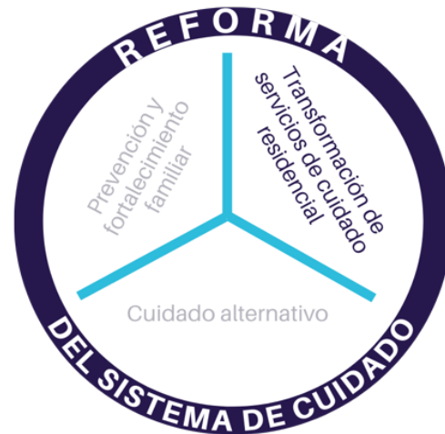
Figura 1: Los tres componentes de un proceso de la reforma del sistema de cuidado

Cambiando la Forma en Que Cuidamos (CTWWC por sus siglas en inglés) está al frente en la búsqueda de la transformación de servicios 4 , procurando que más organizaciones conozcan sobre los beneficios de los cambios propuestos y proveer acompañamiento para las organizaciones que decidan cambiar. CTWWC pertenece a una red más grande de organizaciones que trabajan alrededor del mundo como las Naciones Unidas , Better Care Network (BCN por sus siglas en inglés), Faith to Action y otros proponiendo una agenda de cambio que promueva el cuidado familiar. Diferentes organizaciones han realizado estudios rigurosos que evidencian los aspectos no favorables del cuidado residencial y proponen el cuidado familiar como un mecanismo que prioriza el desarrollo y protección integral de la niñez y adolescencia.