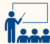
Grupul tehnic 1: Elaborarea mecanismelor privind formarea inițială și continuă a personalului din domeniul asistenței sociale