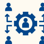
Grupul tehnic 3: Îmbunătățirea mecanismului de supervizare profesională în asistența socială.