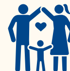
Grupul tehnic 4: Elaborarea cursurilor de formare în domeniul protecției copilului.