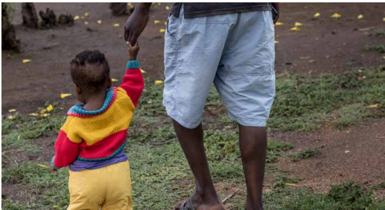
Karen Kasmauski for CRS