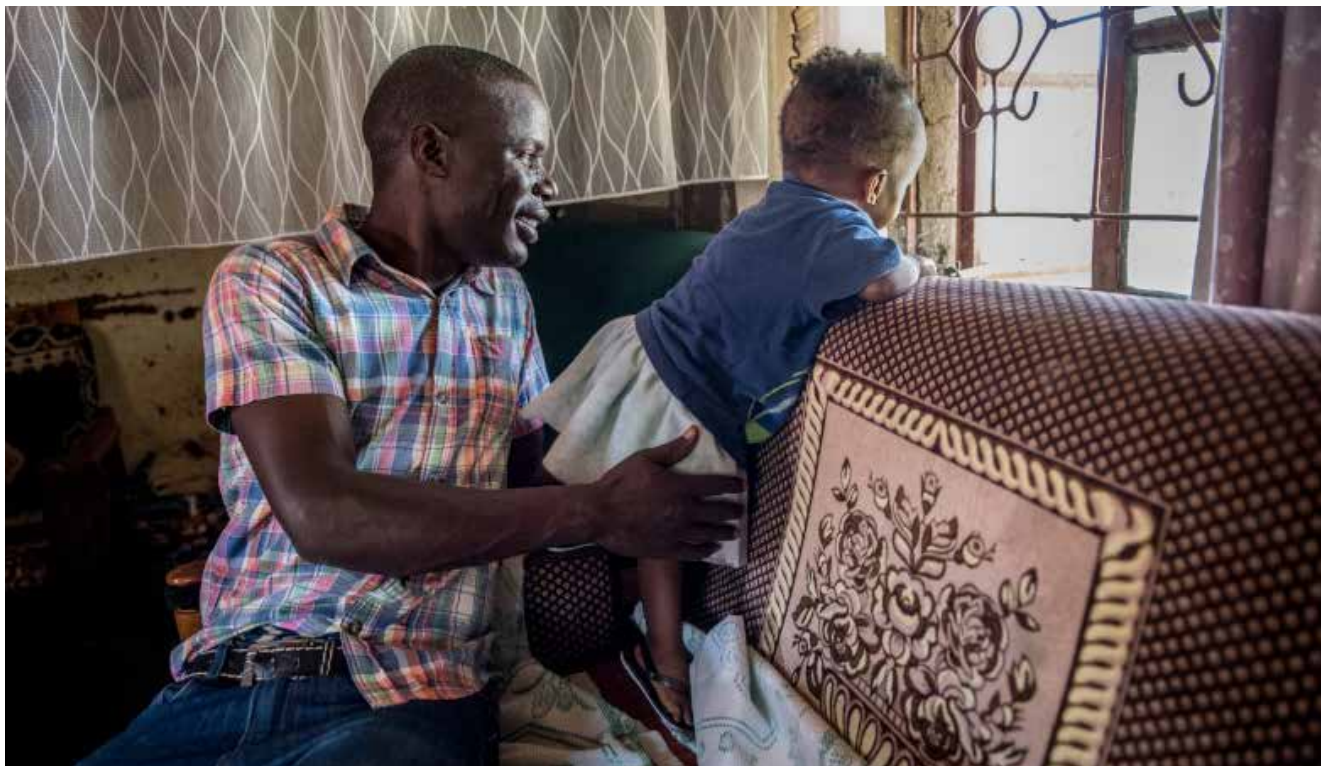
Karen Kasmauski for CRS

Desde la perspectiva de CTWWC, como iniciativa que busca apoyar e informar sobre la reforma del cuidado, es evidente que quienes la apoyan deben adoptar una gestión adaptativa y reconocer que no todos los planes son viables en la práctica. Es necesario encontrar un enfoque de monitoreo adecuado para rastrear y aprender sobre los cambios en los sistemas, y luego compartir ese aprendizaje..