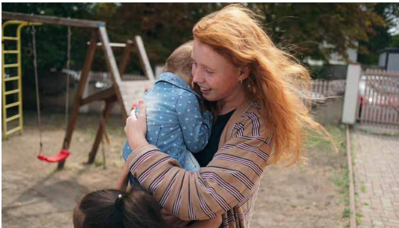
Schimbator Studio for CRS