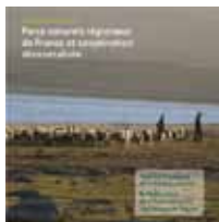
N°8 - Parcs naturels régionaux de France & coopération décentralisée (AFD & Fédération des PNR de France)