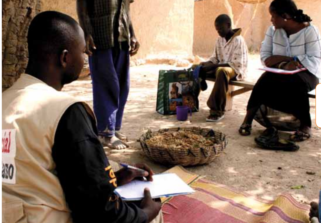
Accompagnement en famille avec les travailleurs sociaux du Samusocial Burkina Faso.