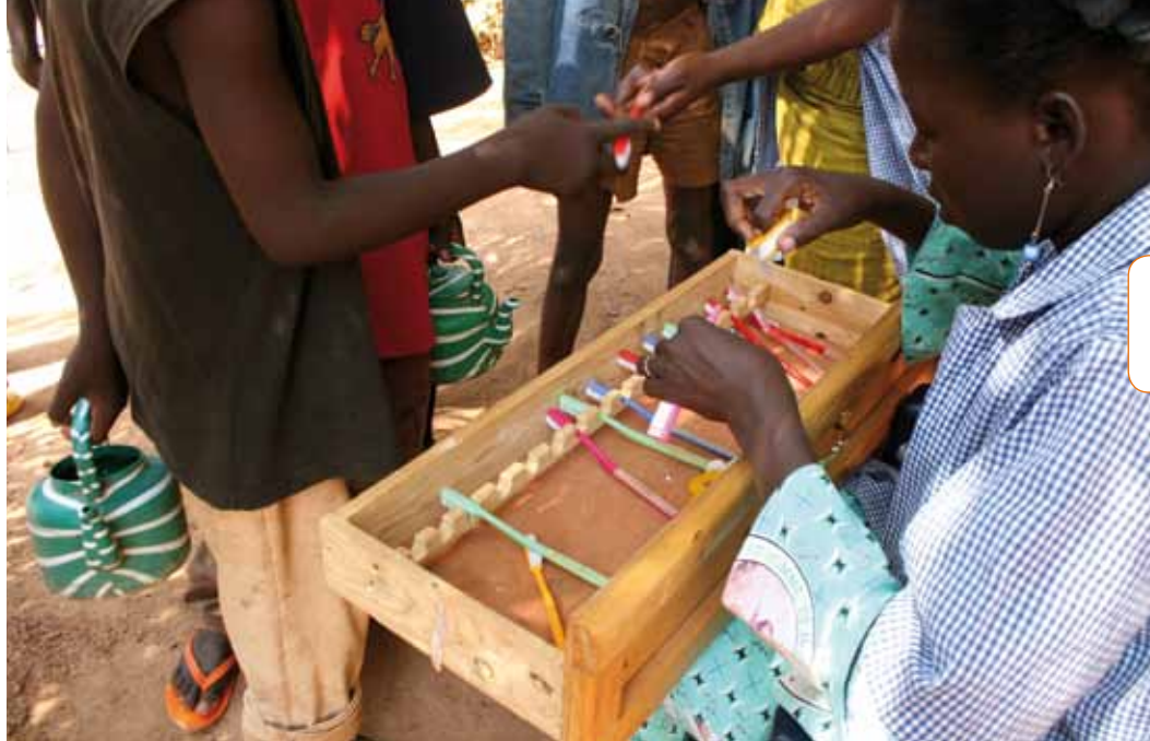
A l'heure de la toilette au centre du Samusocial Burkina Faso.