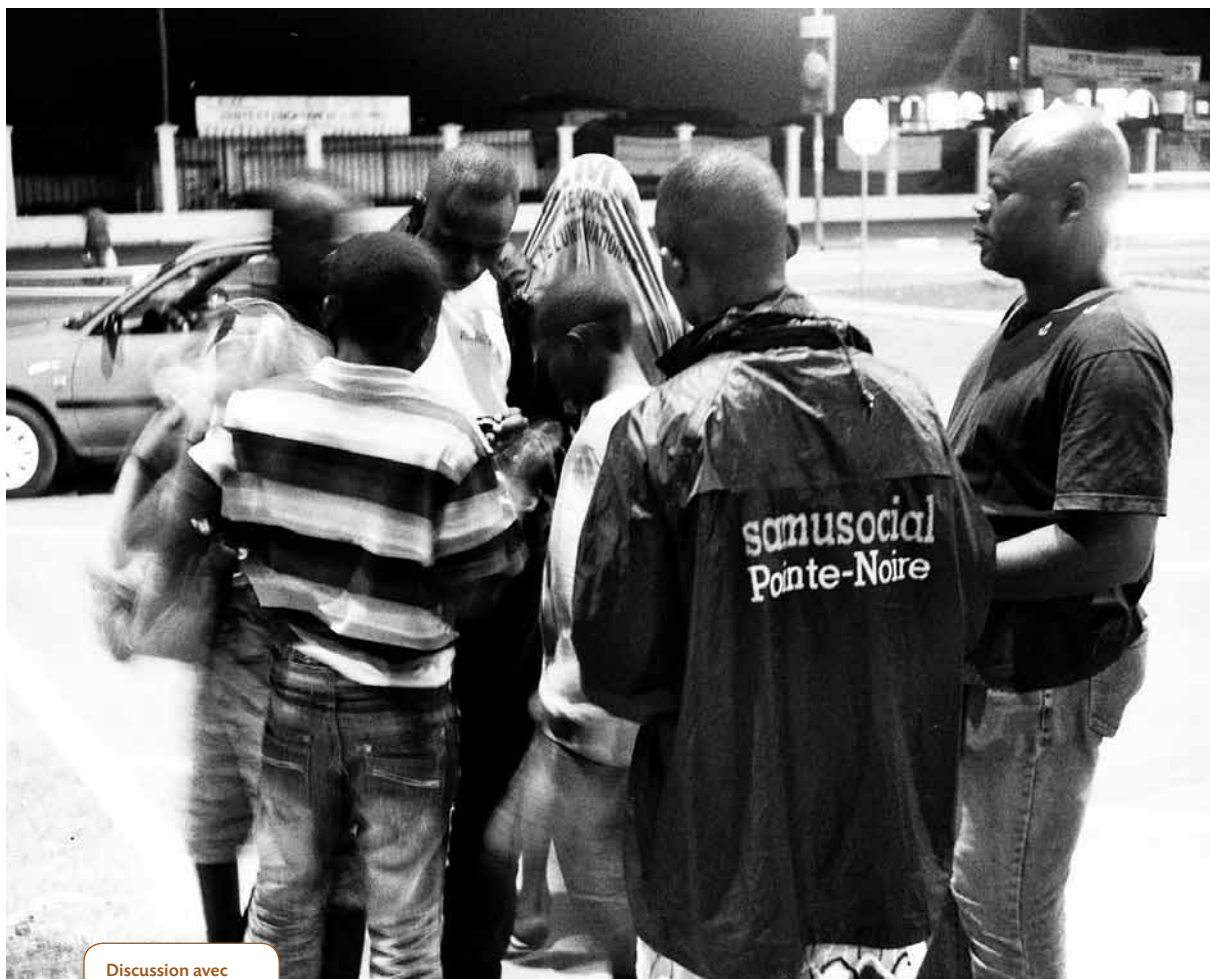
Discussion avec des jeunes de la rue à Pointe-Noire.