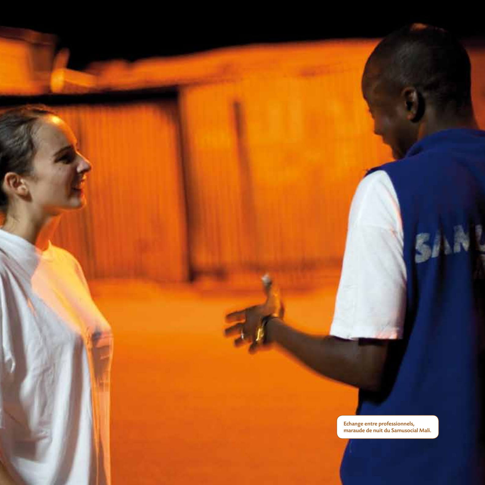
Echange entre professionnels, maraude de nuit du Samusocial Mali.