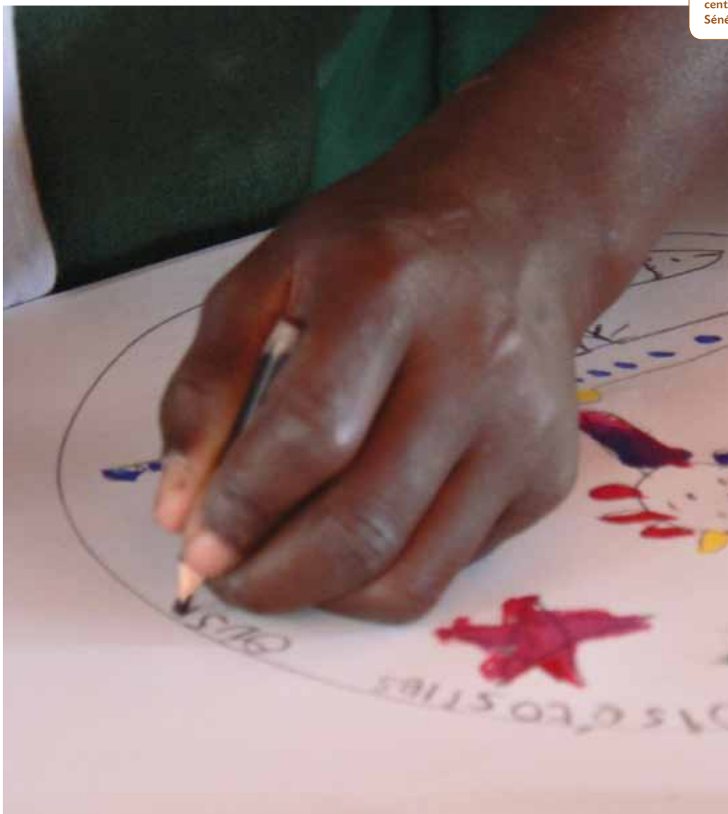
Atelier de peinture au centre du Samusocial Sénégal.