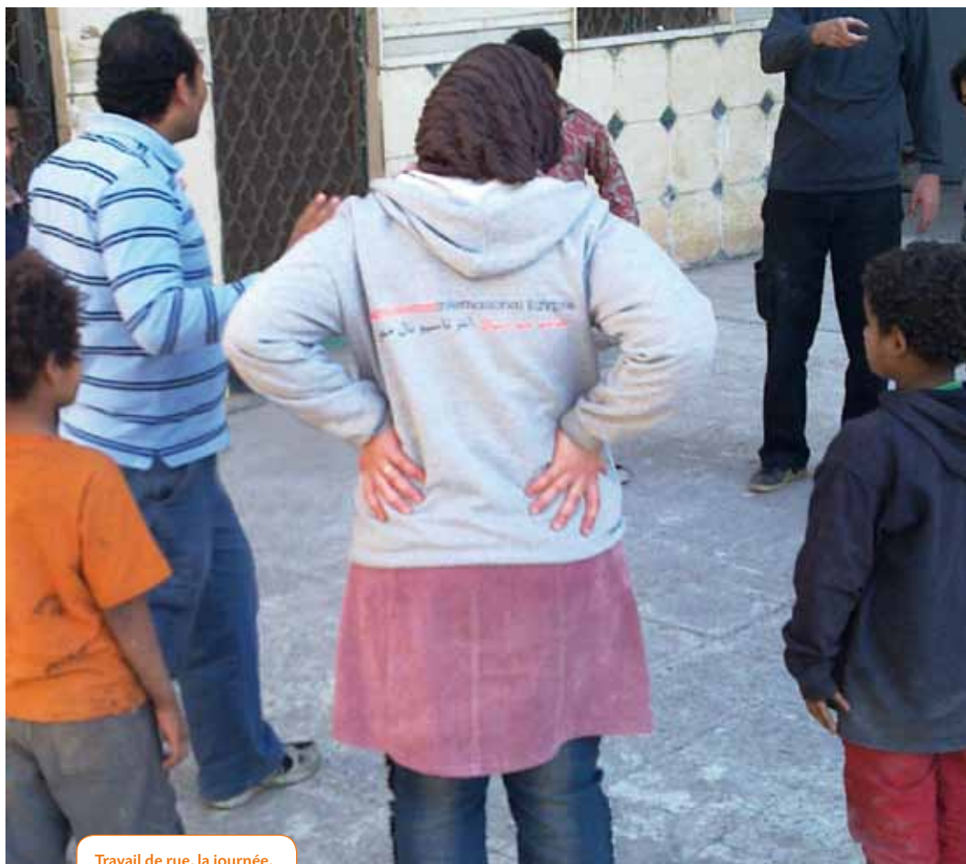
Travail de rue, la journée, au Samusocial International Egypte.

épanouie et économiquement indépendante : mariée, mère de famille et à la tête de sa propre pâtisserie.