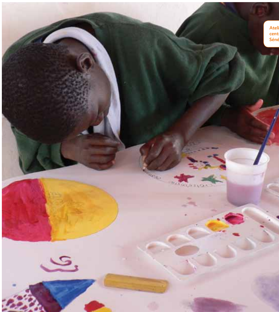
Atelier de peinture au centre du Samusocial Sénégal.