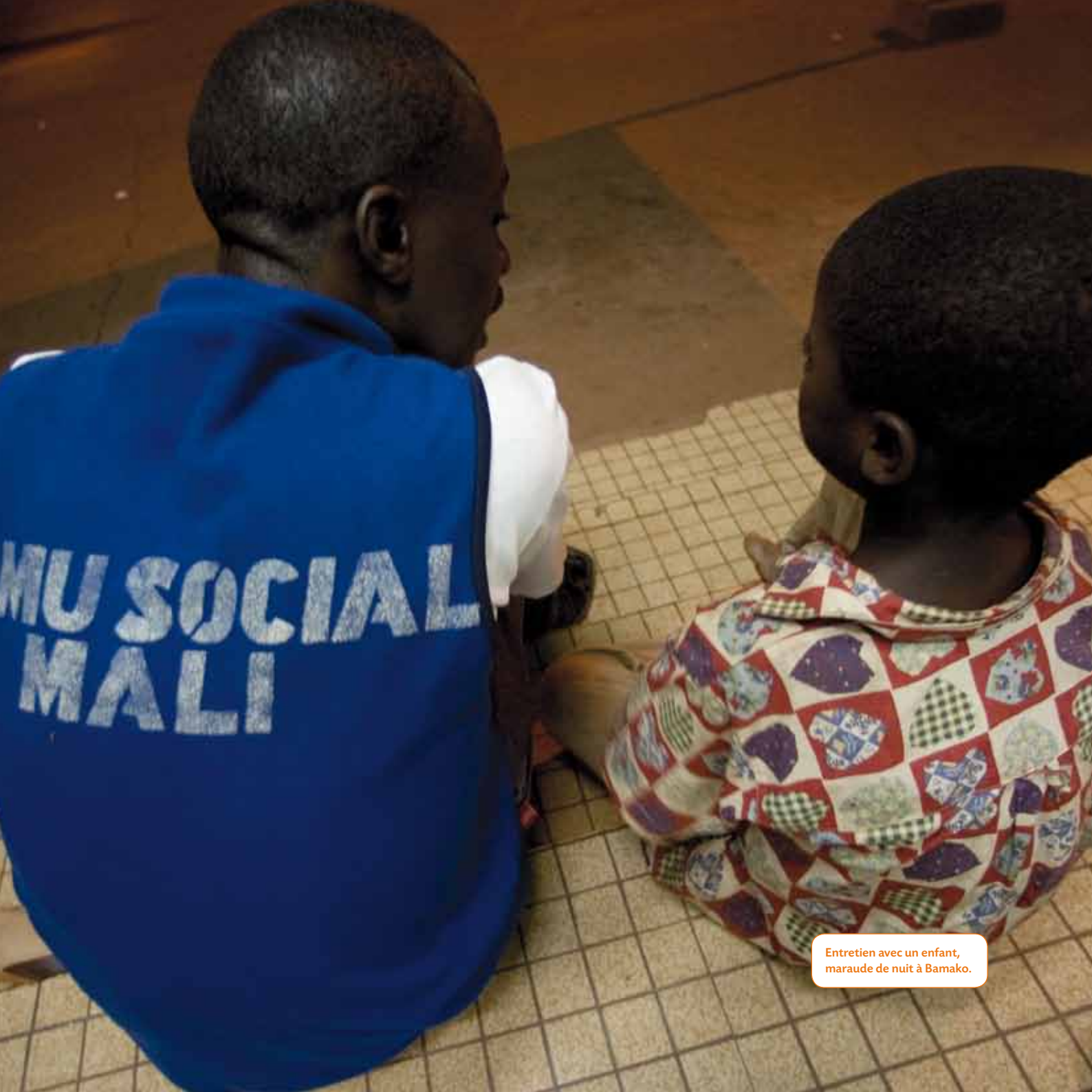
Entretien avec un enfant, maraude de nuit à Bamako.