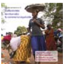
N°4 - Collectivités territoriales & commerce équitable (AFD & Plate-forme pour le commerce équitable)