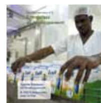
N°6 - Entreprises et développement (AFD & IMS-Entreprendre pour la Cité)