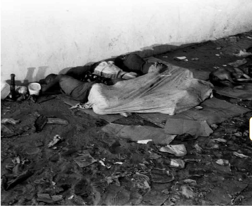
Site de dortoir nocturne à Pointe-Noire.