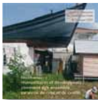
N°2 - Humanitaires et développeurs : comment agir ensemble en sortie de crise et de conflit (AFD & Groupe URD)