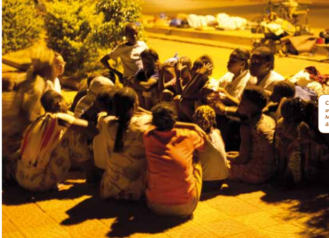
Causerie de groupe avec le Samusocial Mali en maraude de nuit.