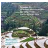
N°10 - Agendas 21 et actions internationales des collectivités (AFD, Région Île-de-France & ARENE)