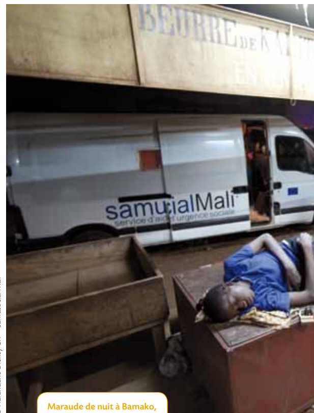
Maraude de nuit à Bamako, arrêt sur un site d'enfants.

11 Contribution d'Olivier Douville, psychologue clinicien et psychanalyste, collaborateur du Samusocial International.