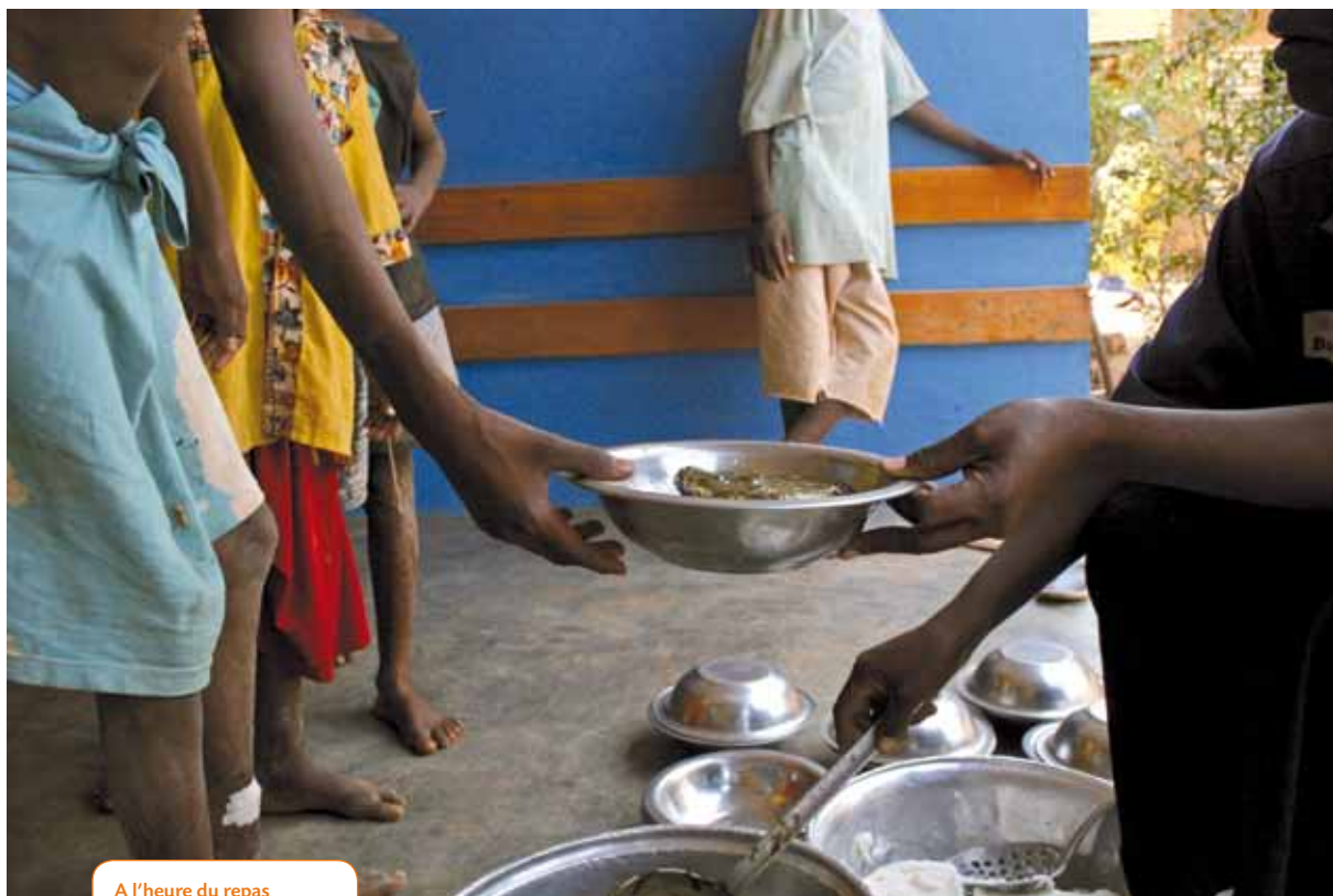
A l'heure du repas au centre du Samusocial Burkina Faso.