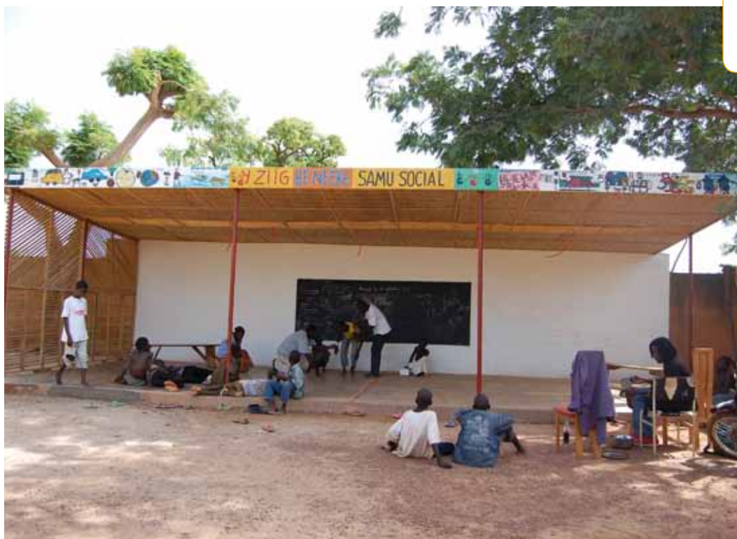
Répétition de théâtre au centre du Samusocial Burkina Faso.

Rupture scolaire et travail des enfants, rupture familiale et exclusion sociale, pour comprendre le phénomène des enfants des rues, il importe de mieux connaître les raisons de leur présence dans la rue et du passage à la vie dans la rue.