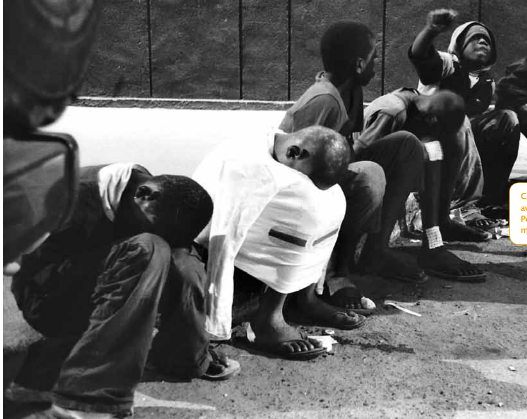
Causerie de groupe avec le Samusocial Pointe-Noire en maraude de nuit.