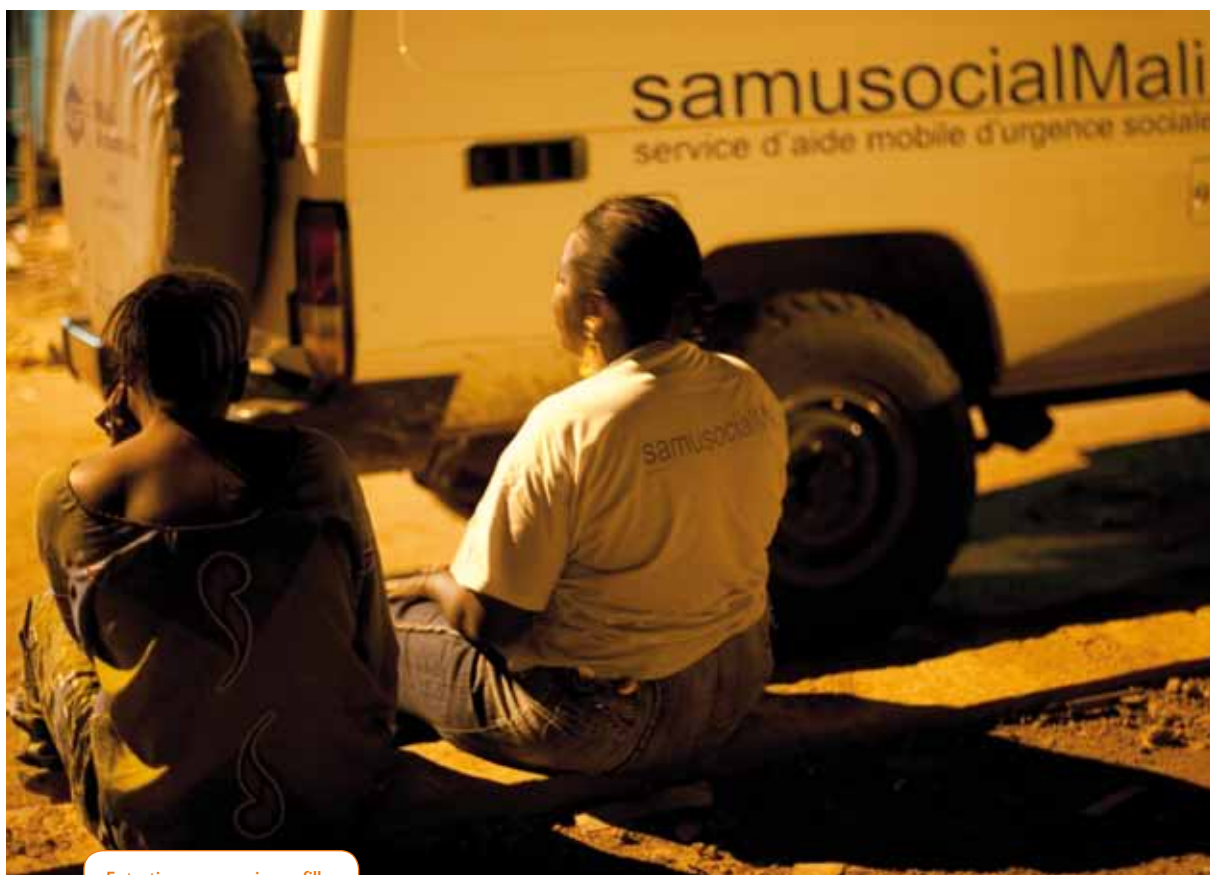
Entretien avec une jeune fille, maraude de nuit à Bamako.