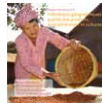
N°9 - Indications géographiques : qualité des produits, environnement et cultures (AFD & Fonds Français pour l'Environnement Mondial)