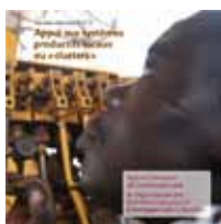
N°5 - Appui aux systèmes productifs locaux ou « clusters » (AFD & ONUDI)