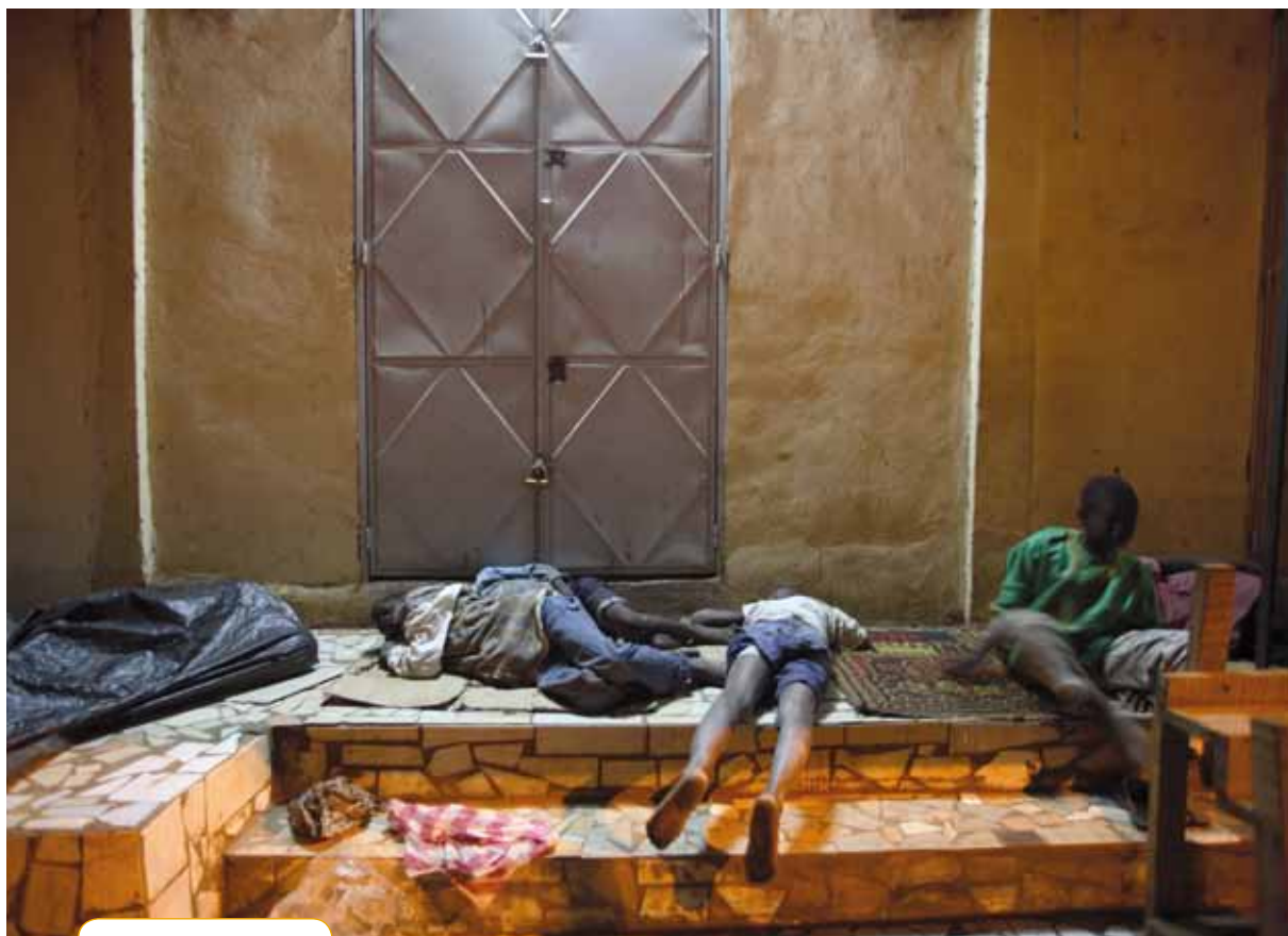
Site de dortoir nocturne à Bamako.