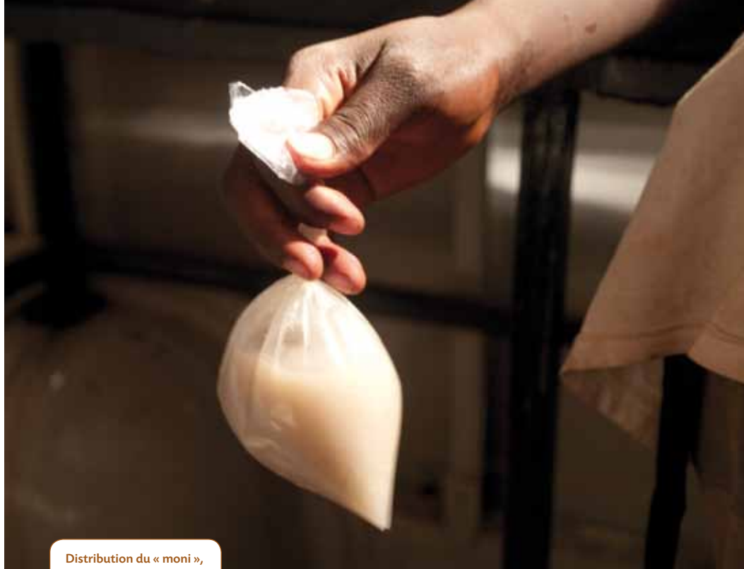
Distribution du « moni », complément nutritionnel à base de mil, par le Samusocial Mali.