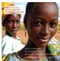
N°11 - Le partenariat avec les sociétés civiles pour le développement (AFD & CCFD - Terre Solidaire)