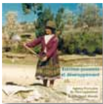
N°1 - Extrême pauvreté et développement (AFD & ATD Quart Monde)