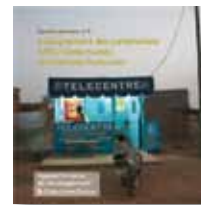
N°3 - Enseignement des partenariats AFD/Collectivités territoriales françaises (AFD & Cités Unies France)