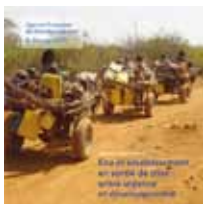
N°7 - Eau et assainissement en sortie de crise : entre urgence et développement (AFD & Groupe URD)