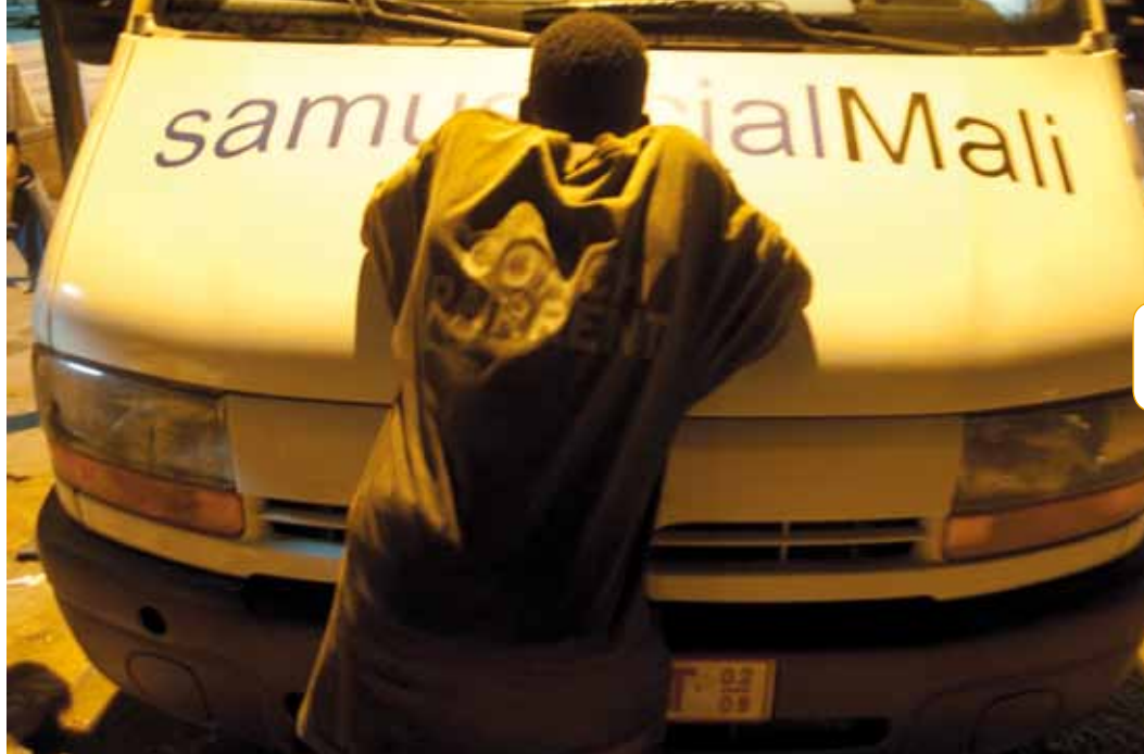
En maraude de nuit à Bamako.