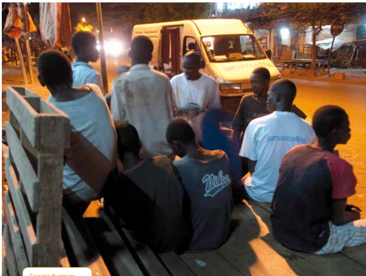
Causerie de groupe avec le Samusocial Mali en maraude de nuit .