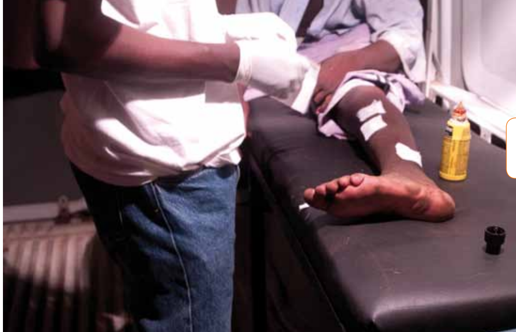
Soin médical à bord du centre mobile d'aide du Samusocial Mali.