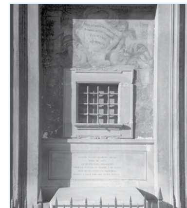
Място за оставяне на бебета във Флоренция (14 та -18 та в.)

Подходите към тайното изоставяне на деца в ЕС варират. В някои страни вече не е незаконно да се остави дете, при условие, че това стане на безопасно място. В някои европейски страни съществуват т.нар. бейби хатч (baby hatches) - специални безопасни места, където майките могат да оставят бебета си за отглеждане от други хора, като запазят анонимността си. От 27-те страни-членки на ЕС,